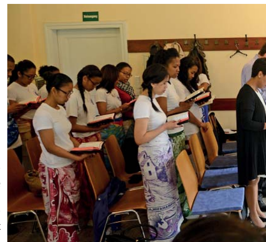
Provisorium: Die madegassische evangelische Gemeinde in Dachau muss ihren Gottesdienst-Raum jedesmal erst herrichten.