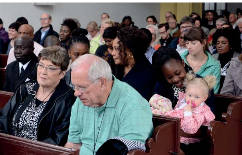
Gemischt: Zum internationalen Pfingstgottesdienst in München kommen auch Menschen aus landeskirchlichen Gemeinden.

sprachlich-kulturellen Hintergrund, organisatorischer Verfasstheit, in Grösse und sozialen Rahmenbedingungen, historischer Genese und in den persönlichen Geschichten. Wir vermeiden es,